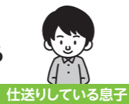
仕送りしている息子