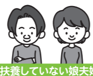
扶養していない娘夫婦

加入者の範囲等の詳細についてはP.18「団体扱契約にご加入できる場合」をご参照ください。